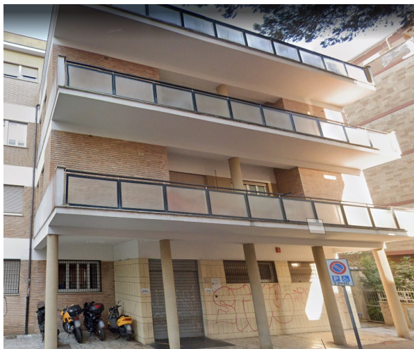
Poliambulatorio di Ostia

Le attività del Centro si rivolgono a tutti i lavoratori del territorio nazionale, con esclusione dei dipendenti della ASL Roma 3.