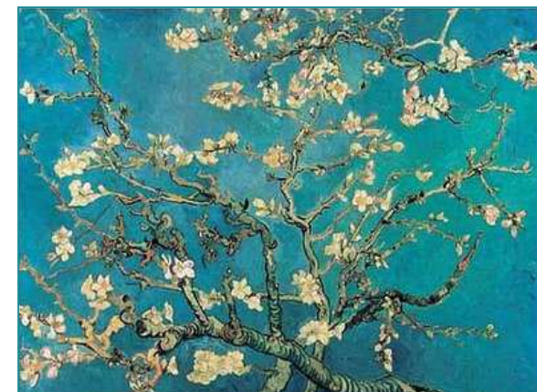
Vincent Van Gogh - Ramo di mandorlo fiorito 1890

per informazioni sui servizi della ASL Roma D, suggerimenti o reclami è possibile rivolgersi al numero verde